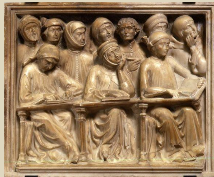
Particolare dell'Arca monumentale di Giovanni da Legnano (1383)

Trattati di 'pedagogia giuridica' nell'Università del Quattrocento