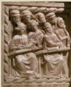
Sepolcro di Roberto e Riccardo da Saliceto (1403): particolare

https://univr.zoom.us/meeting/register/tZYpdOmurDgoG9DJ1_ejgRYrOBn7t030AtuE